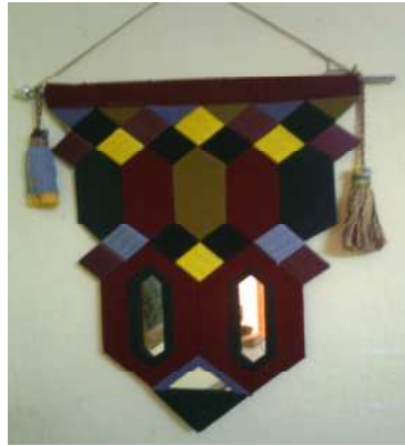
❖ مشغولة (٢) معلقة