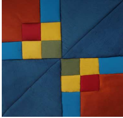
❖ مشغولة (١) تكاية

وفيما يلي عرض وتحليل للمشغولات المنفذه نتائج البحث